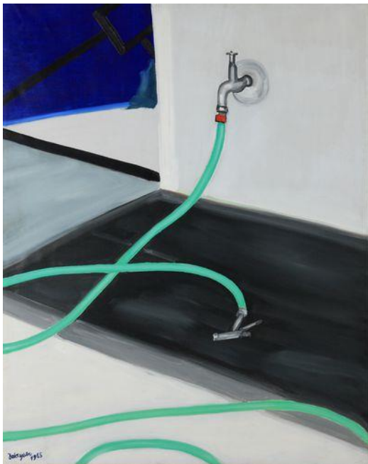
Raoul De Keyser

Europa is in de ban van de popart. In de Londense Tate Modern kan je naar The World Goes Pop , Andy Warhol is te gast in het Parijse Musée d'Art Moderne, en dichterbij ons opende Pop Art in Belgium! . Daarvoor moet je naar het ING Art Center in Brussel. Het loont de moeite. De sixties doen het keer op keer.